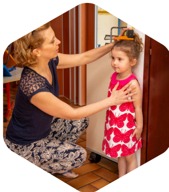
Bilan de santé en école maternelle et éducation à la santé