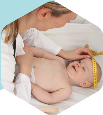
Suivi médical enfants