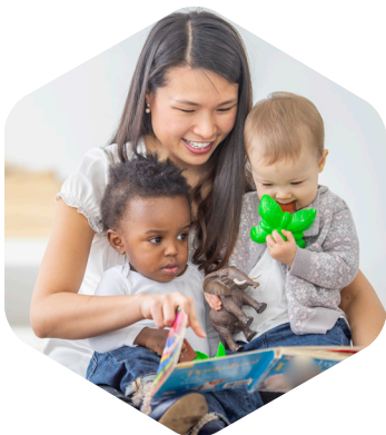
Agrément des modes d'accueil des jeunes enfants