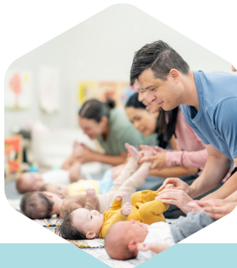
Ateliers participatifs parents/enfants