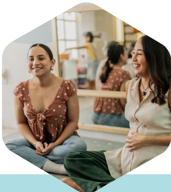
Ateliers préparation à la naissance